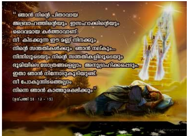
SN Poster 5

തിരുവചനങ്ങൾ വായിച്ച ശേഷം കുട്ടികൾ ഗ്രൂപ്പുകളിൽ ചർച്ചചെയ്ത് ഒരു പത്രവാർത്ത ഉണ്ടാക്കി അവതരിപ്പിക്കുന്നു. തുടർന്ന് ബോർഡിൽ പ്രദർശിപ്പിച്ച പോസ്റ്റർ കാണുകയും രേഖപ്പെടുത്തിയിരിക്കുന്നവ മനഃപാഠമാക്കുകയും ചെയ്യുന്നു. പോസ്റ്റർ മാറ്റിയ ശേഷം ഉൽ 28:13-15 ലെ പദങ്ങൾ രേഖപ്പെടുത്തിയ കാർഡുകൾ ക്രമം തെറ്റിച്ച് നൽകിയിരിക്കുന്നത് ഗ്രൂപ്പിൽനിന്ന് ആവശ്യപ്പെടുന്ന ആളുകൾ ഫ്ലാൻ ബോർഡിൽ ഓർമ്മയിൽ നിന്ന് ക്രമീകരിക്കുന്നു. ആദ്യം റഡിയാകുന്നവർക്കും തെറ്റാതെ ക്രമീകരിക്കുന്നവർക്കും സ്കോർ നൽകാം.